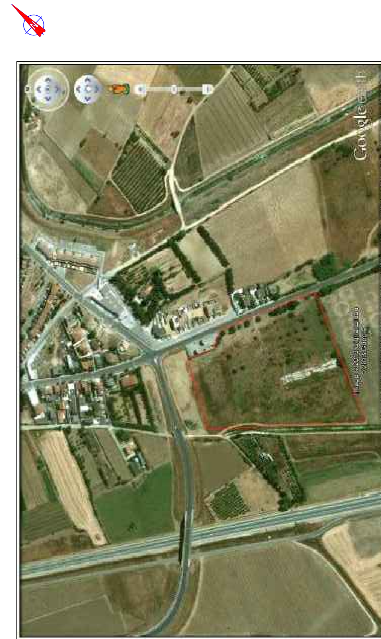
PRESA FOTOGRAFICA SATELLITARE